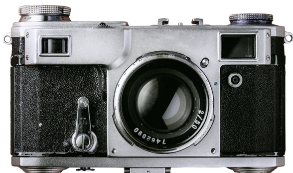
Jouw alinea tekst

Op dinsdag 27 februari gaan al onze midden- en bovenbouw groepen op de foto.